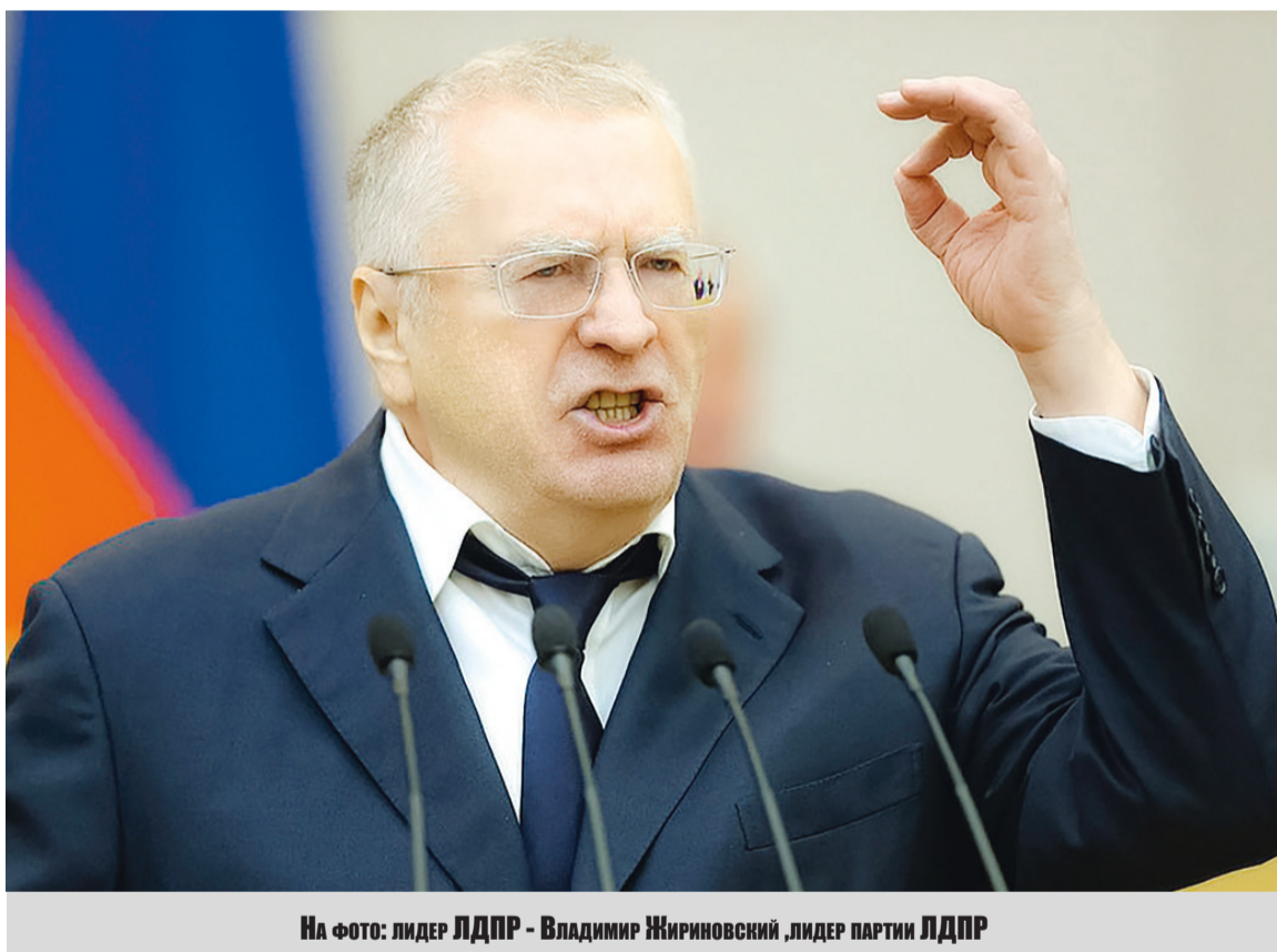
На фото: лидер ЛДПР - Владимир Жириновский, лидер партии ЛДПР

По мнению Владимира Жириновского, участие в военных конфликтах нужно тщательно продумывать, где-то нужна дипломатия, а где-то наоборот – более решительные действия.