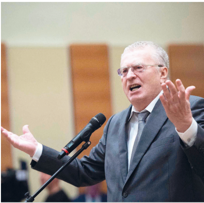
На фото: лидер партии ЛДПР Владимир Жириновский

Лидер ЛДПР рассказал, что предлагал главному редактору одного из крупных телеканалов убрать из эфира две наиболее вредные, по мнению полити-