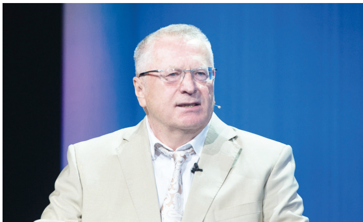
На фото: руководитель партии ЛДПР - Владимир Жириновский

13 сентября 2020 года – единый день голосования. В этот день состоятся выборы в Орловский городской Совет