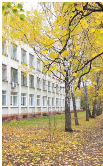
На фото: школа №5, г. Орел

В 2017 г. по г. Орлу получили помощь 15 учреждений, среди которых школы, больницы и детские сады. Это и школа № 5 г. Орла, которая крайне нуждалась в замене оконных блоков, а также было приобретено оборудование для холодильной камеры. Смогли заменить оконные блоки, благодаря ЛДПР, в этом году в МБОУ «Детский сад № 17» г. Орла. Отремонтировали кровлю в блоке начальной школы в МБОУ, заменили оконные блоки в спортзале – в средней общеобразовательной школе № 37 имени дважды Героя Советского Союза маршала М.Е. Катукова г. Орла. Усилиями депутатов ЛДПР была оказана существенная помощь Орловской общеобразовательной школе для обу-