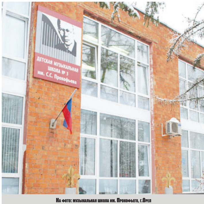
На фото: музыкальная школа им. Прокофьева, г.Орел

В 2019 году смогли сделать ремонт мягкой кровли в муниципальной бюджетной средней общеобразовательной школе № 37 города Орла, отремонтировали внутренние помещения в МБДОУ – детский сад № 9, была приобретена интерактивная доска в муниципальный бюджетный общеобразовательный лицей № 18. Очень долго ждали финансирования в библиотеке им. Пришвина для