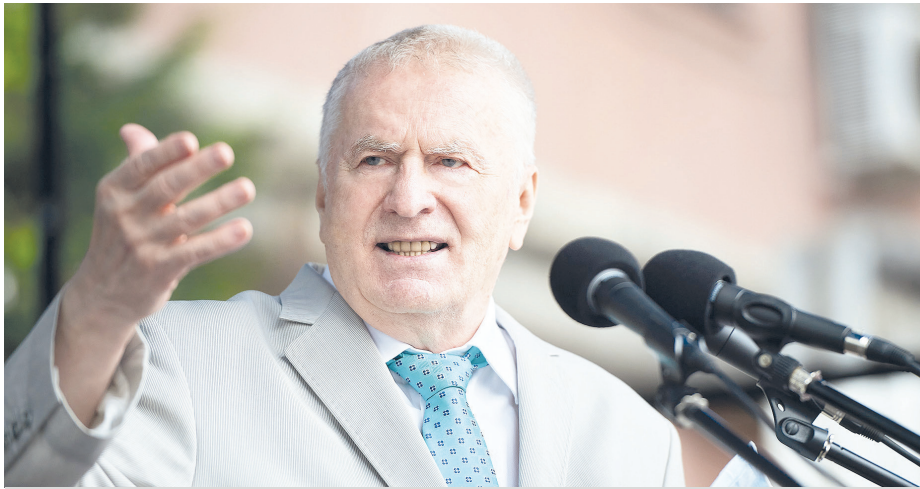
На фото: руководитель партии ЛДПР - Владимир Жириновский

Множество людей в России болеет из-за плохого питания, плохого медицинского обслуживания и плохой экологии.