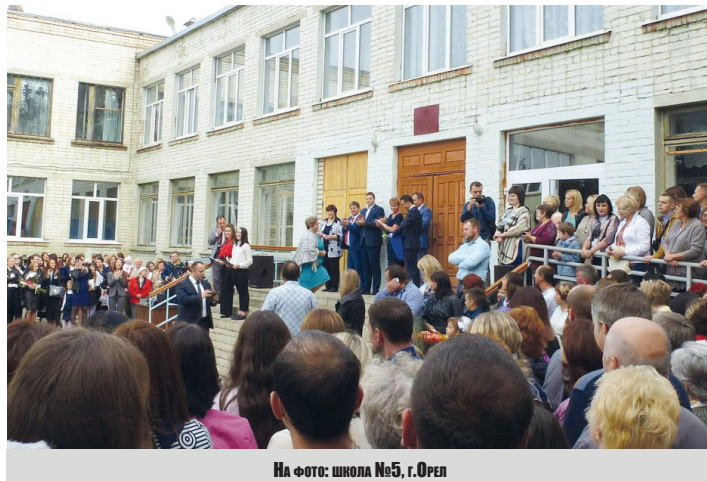
На фото: школа №5, г.Орел

В 2020 году ЛДПР уже помогла приобрести и установить на служебный автобус системы ГЛОНАСС и Тахограф-57 для Всероссийского общества инвалидов «Заводская районная общественная организация Орловской областной общественной организации», ряд учебных заведений с помощью ЛДПР смогли произвести текущий ремонт (МБУ ДО «Детская школа искусств №2 им. М. И.