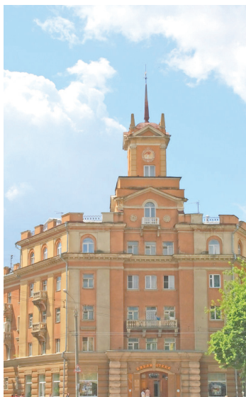
На фото: библиотека им. Пришвина, г. Орел

Все депутаты ЛДПР на Орловщине действуют дружной и единой командой. За период с 2017 по 2020 г.г. с помощью депутатов ЛДПР получили поддержку и решили свои проблемы учреждения, на которые средства не выделялись годами, как в районах, так и в г. Орле.