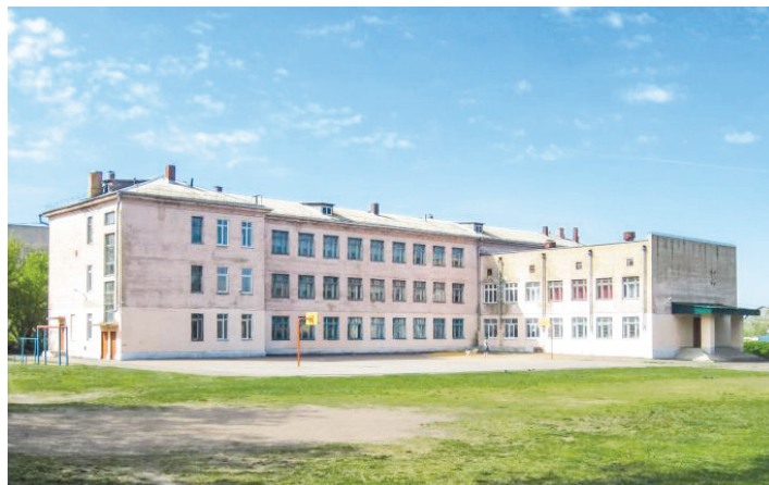
На фото: школа № 31, г.Орел

диму школьную мебель. Муниципальная бюджетная средняя общеобразовательная школа № 31 г. Орла по ул. Лесная, отремонтировала учебный кабинет при поддержке ЛДПР.