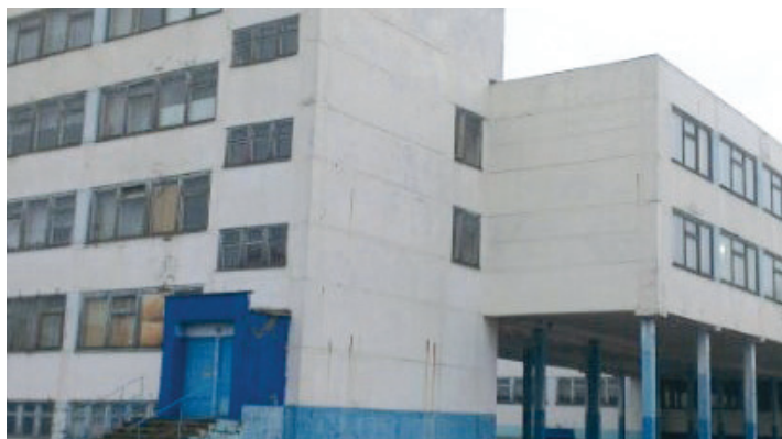
На фото: школа № 37 им. дважды Героя Советского Союза маршала М.Е.Натукова, г.Орел

Оказали помощь БУЗ Орловской области «Детская поликлиника № 3», МБ ДОУ «Детский сад № 33» г. Орла на бульваре Победы, д. 4, где смогли, благодаря ЛДПР, отремонтировать теневые навесы. Теперь жаркое солнышко воспитанникам не грозит перегревом. В школе № 5 г. Орла приобрели необхо-